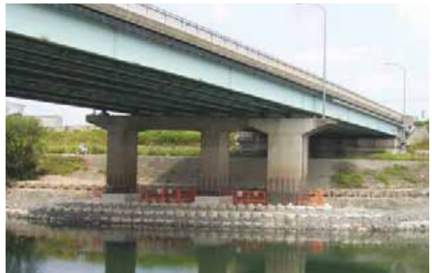
出水期に入るまでの作業を完了した状況