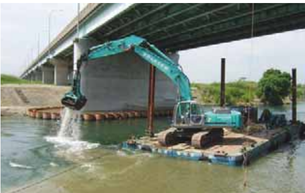
押さえ盛土撤去(1.2 m 3 級バックホーによる水上施工)