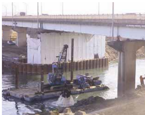
クラムセルによる捨石の撤去状況

鋼矢板の打設に先立ち、水中の捨石を撤去する必要があります。これは護岸として築造されたもので、最大径が1 mに達する巨石でした。