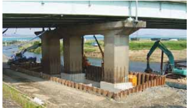
地中部の補強工事が完了し仮設物の撤去前のP1橋脚

鋼矢板による締切りが完了後、内部の水替えをして掘削作業を行いました。次に、橋脚基礎の天端まで堀下げ、コンクリートの巻立補強を行いました。この地中部の施工が終わった後に、埋戻しを行って仮設物を撤去し、出水期を迎えました。