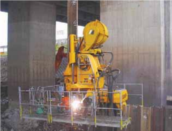
油圧式圧入機による鋼矢板の圧入作業状況

土留・仮締切りを行うため、橋脚周辺に長さ11.0~14.5 mの鋼矢板を油圧式圧入機で圧入しました。このとき高さ制限を受けるため、鋼矢板を工場で切断加工して、継ぎ矢板で施工しました。