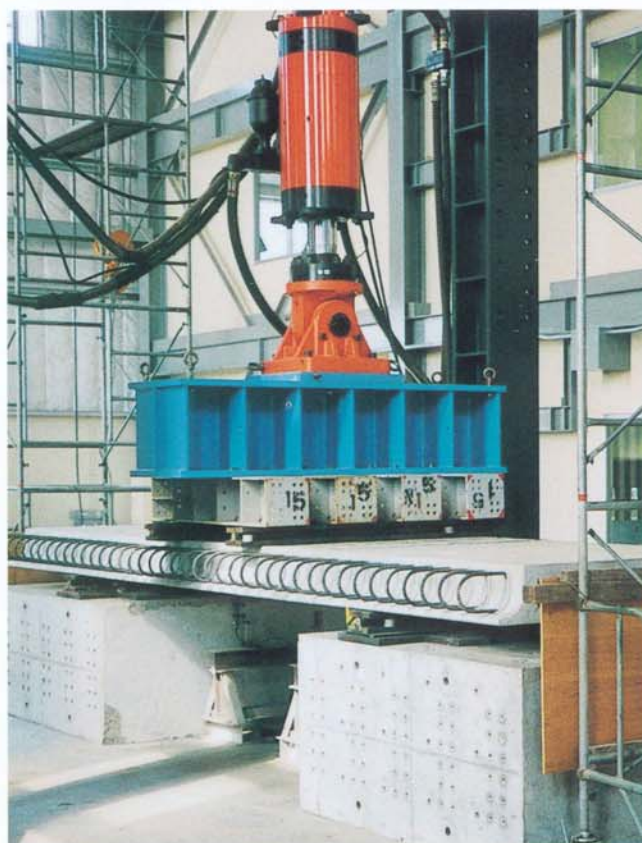
プレキャストPC床板の接合部試験