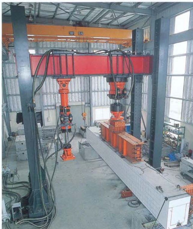
ハーフプレキャスト合成はり試験