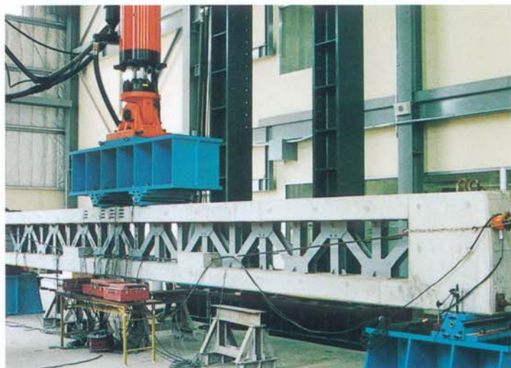
複合トラスはり載荷試験